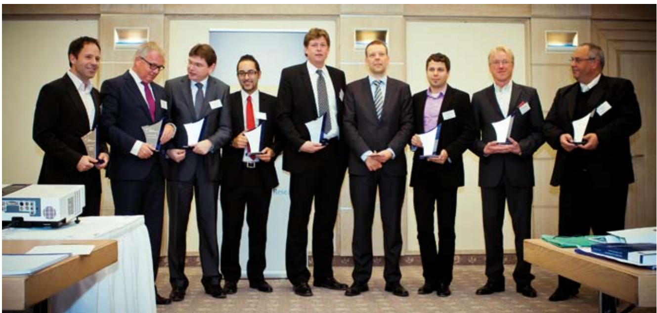
Preisträger des Jahres 2011