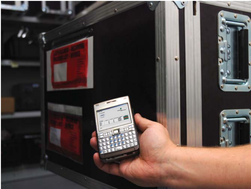
Abb. 2: Auslesevorgang des Ersatzteilbehälters mit einem mobilen Endgerät

ist ein effektives und effizientes Zusammenspiel beider Prozesse mit dem Ziel, dem Kunden einen optimalen Service und eine schnelle nachhaltige Instandsetzung zu bieten. Für den Transport der Ersatzteile werden häufig spezielle Transportbehälter verwendet, mit denen die überschüssigen Ersatzteile oder auch ausgebauten Teile zur Wartung an das Ersatzteillager zurückgeschickt werden.